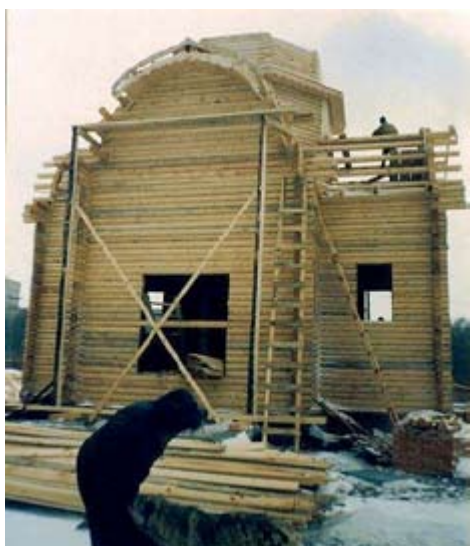
Начало приходской жизни