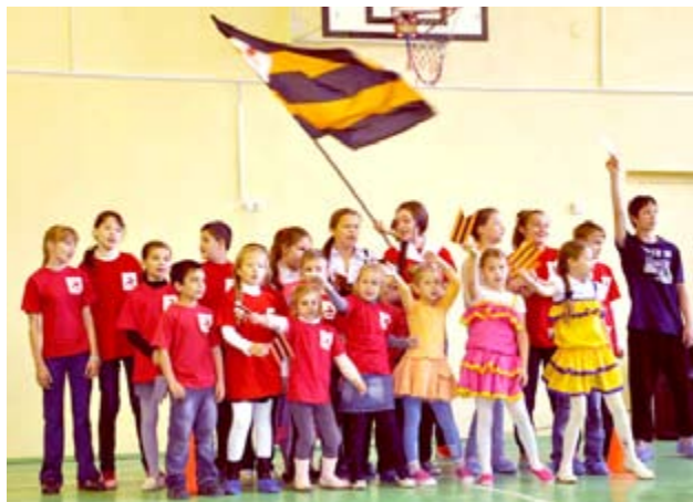
Папа, мама, я - православная спортивная семья