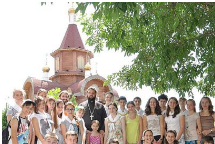
Молодежный клуб Благо-Дать