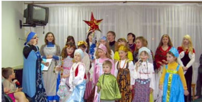
Выступления Воскресной школы