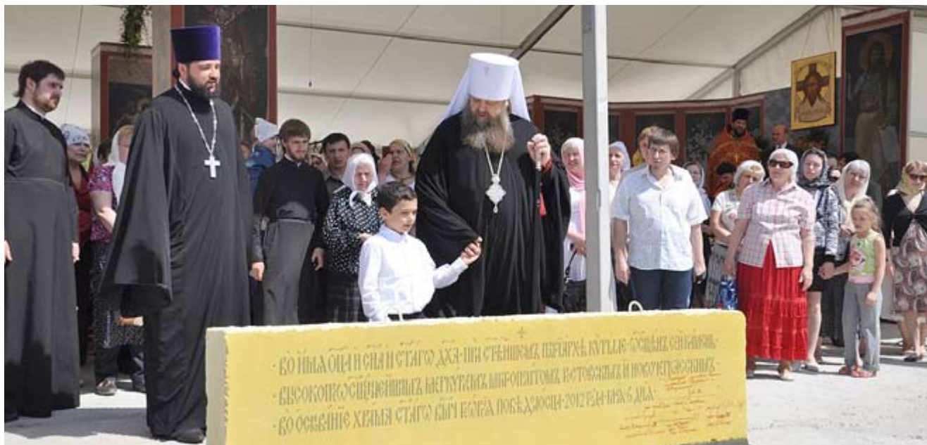
Престольный праздник. 2012 год