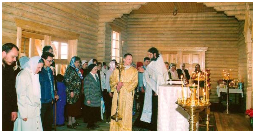
Первая служба в храме