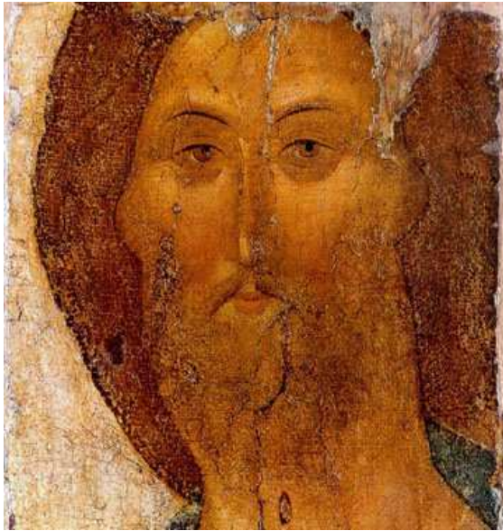
Андрей Рублёв. «Спас». Икона из «Звенигородского чина». Ок. 1394г. Государственная Третьяковская галерея. Москва